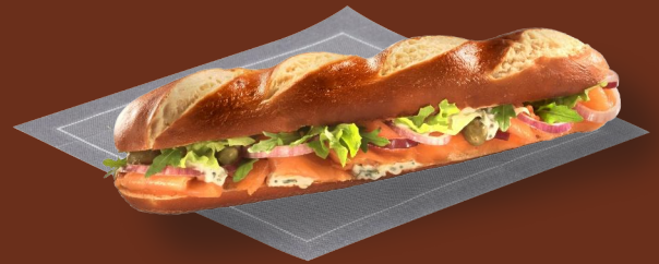
Sándwich de salmón ahumado 6 99 € Tzatziki, lechuga, alcaparras, cebolla