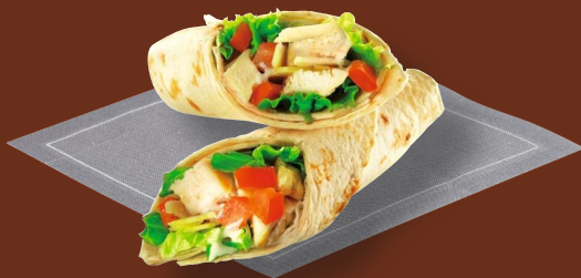
Rollo de pollo César 6 99 € Tortilla, salsa César, lechuga romana y queso Parmesano