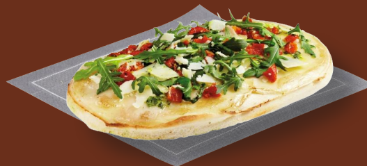
Bruschetta de tomate 7 49 € Con rúcula