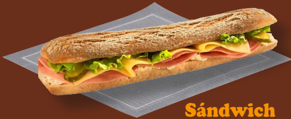
Sándwich de jamón 6 49 € Queso, lechuga y pepinillos