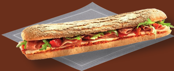
Sándwich de jamón curado 6 99 € Mozzarella, tomate confitado, rúcula