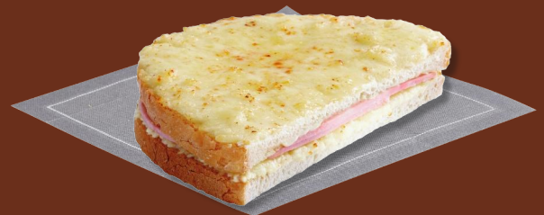
Sandwich de jamón y queso tostado 7 49 €